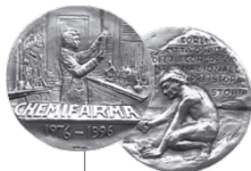
Medaglia coniat del 20° anniversario della fondazione 1976-1996. Medal coined for the XX anniversary of the foundation 1976-1996.