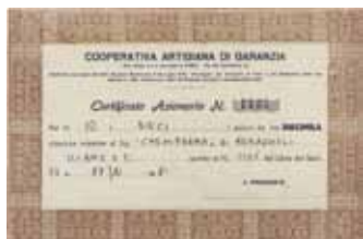
Certificato Azionario depositato nel 1981 presso la Cooperativa Artigiana di Garanzia. Stock certificate lodged in 1981 with Cooperativa Artigiana di Garanzia.